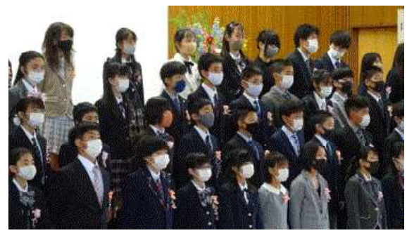
卒業生からのメッセージ

また、式当日5年生は、リモートで参加となりましたが、6年生への感謝の気持ちや次を担う覚悟のメッセージを直接伝えることができました。本年度も規模縮小の卒業式ではあったものの、参加者全員の心がギュッと詰まった卒業式になりました。卒業生が希望に満ちた中学校生活を送ることを切に願っています。