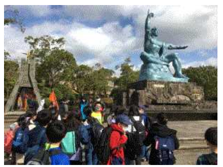
長崎へ日帰りの修学旅行

本日、令和2年度の修了式を無事に迎えることができました。本年度は、新型コロナウイルスの感染拡大に大きな影響を受けた1年間でした。分散登校から始まり、マスク着用の学校生活。規模縮小の分散運動会。学年ごとの人権文化祭と6年生を送る会。日帰りの自然体験教室、修学旅行。5年生のリモート参加となった卒業式。できなかったことも多かったのですが、工夫しながらどうにか楽しい行事にすることができたのではないかと思います。何よりも、昨年度のように、臨時休校で学校が終わるのではなく、最後まで学校生活を送ることができたことがよかったです。